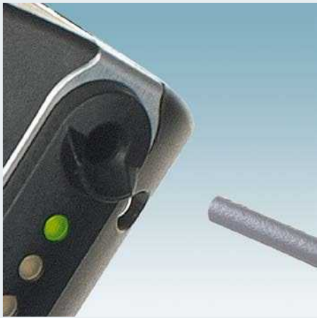
Einfach den Leiter einführen, ...