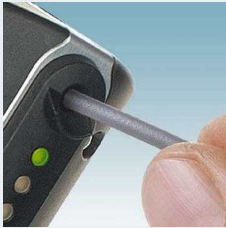
... automatisch abisolieren und crimpen ...